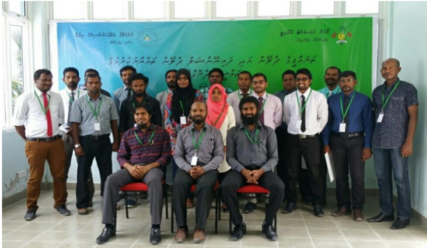
۱. ایگزیکٹو مینٹل سروس پروگرام کے افتتاحی تقریب میں شرکت کرنے والے سربراہان کی گروپ تصویر میں: ایگزیکٹو مینٹل سروس پروگرام کے سربراہان کی سروس پروگرام کے ڈائریکٹر میں: م. م. م. تاریخ: 06 دسمبر 2016