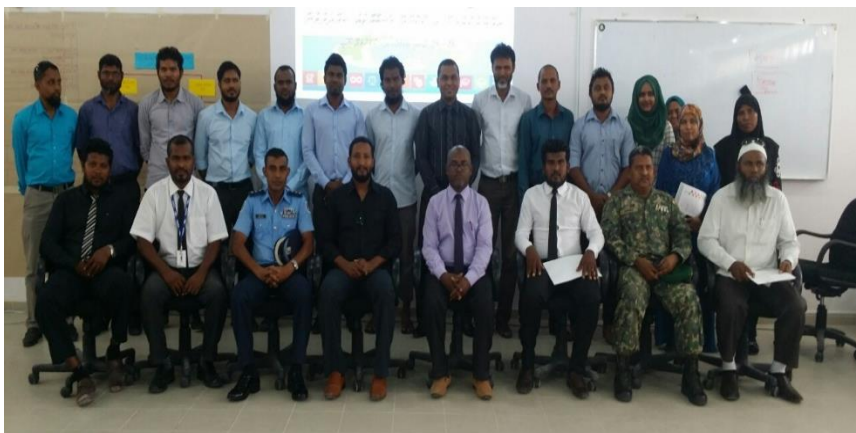
۳. ایگزیکٹو مینٹل سروس پروگرام کے افتتاحی تقریب میں شرکت کرنے والے سربراہان کی گروپ تصویر میں: ایگزیکٹو مینٹل سروس پروگرام کے سربراہان کی سروس پروگرام کے ڈائریکٹر میں: م. م. م. تاریخ: 22 دسمبر 2016