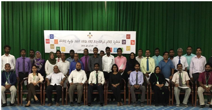
۲. ایگزیکٹو مینٹل سروس پروگرام کے افتتاحی تقریب میں شرکت کرنے والے سربراہان کی گروپ تصویر میں: ایگزیکٹو مینٹل سروس پروگرام کے سربراہان کی سروس پروگرام کے ڈائریکٹر میں: م. م. م. تاریخ: 06 دسمبر 2016